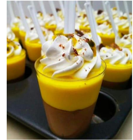
MOUSSE DE CHOCOLATE Y MARACUYA