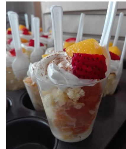
DULCE DE TRES LECHES CON FRUTAS