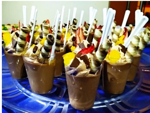
MOUSSE DE CHOCOLATE FRUTAL Y CROQUITOS