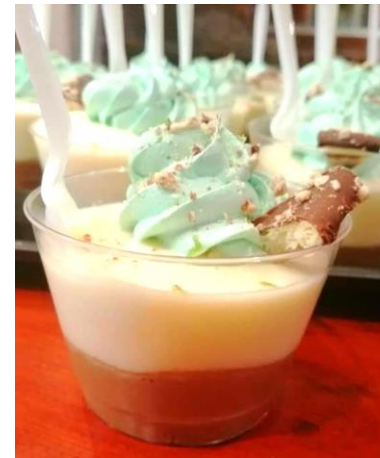
MOUSSE DE LIMON PRESENTACION 5 ONZ.