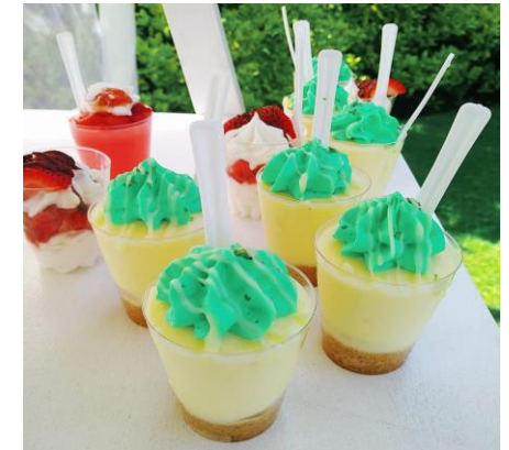
MOUSSE DE LIMON