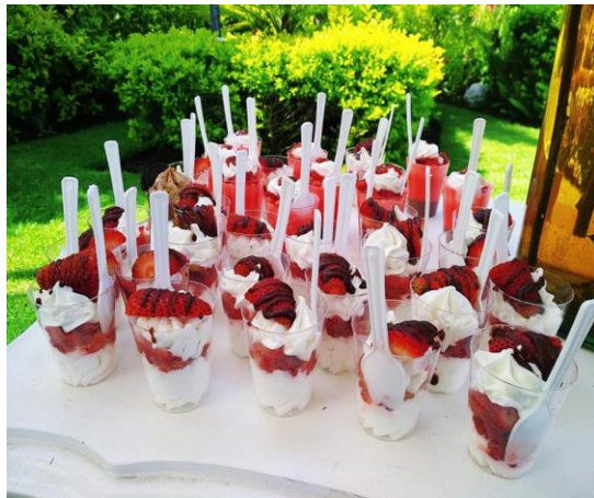
FRUTILLAS CON CREMA