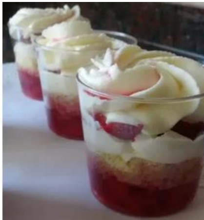
CHEESCAKE DE FRUTILLA