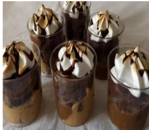
BROWNIE CON DULCE DE LECHE, GANACHE Y MERENGUE