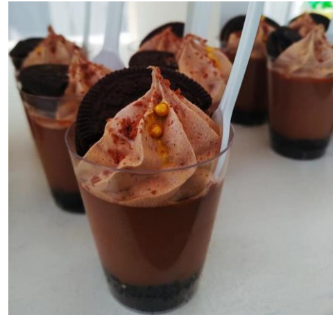
MOUSSE DE CHOCOLATE Y OREO