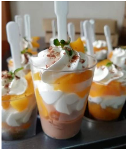
FANTASIA DE DURAZNO