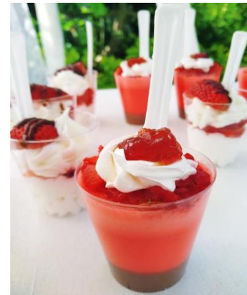
MOUSSE DE FRUTILLA