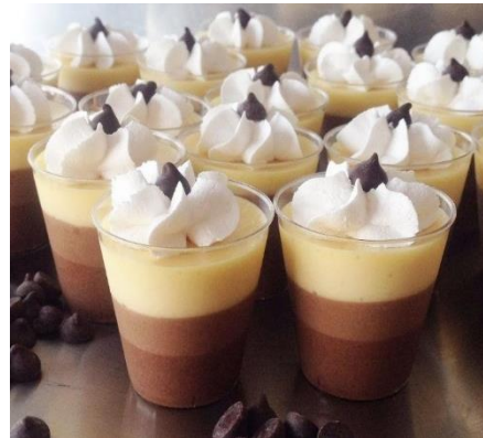
MOUSSE DE CHOCOLATE Y PUDIN DE VAINILLA CON CHISPAS DE CHOCOLATE